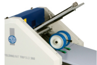
Detalle salida escamada